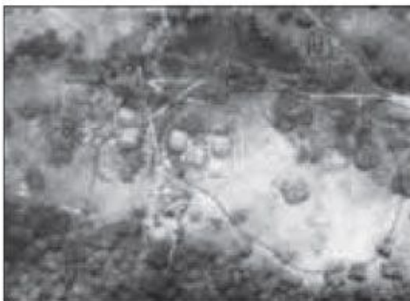
Paióis destruídos após impactos de bombas napalm , no alvo.