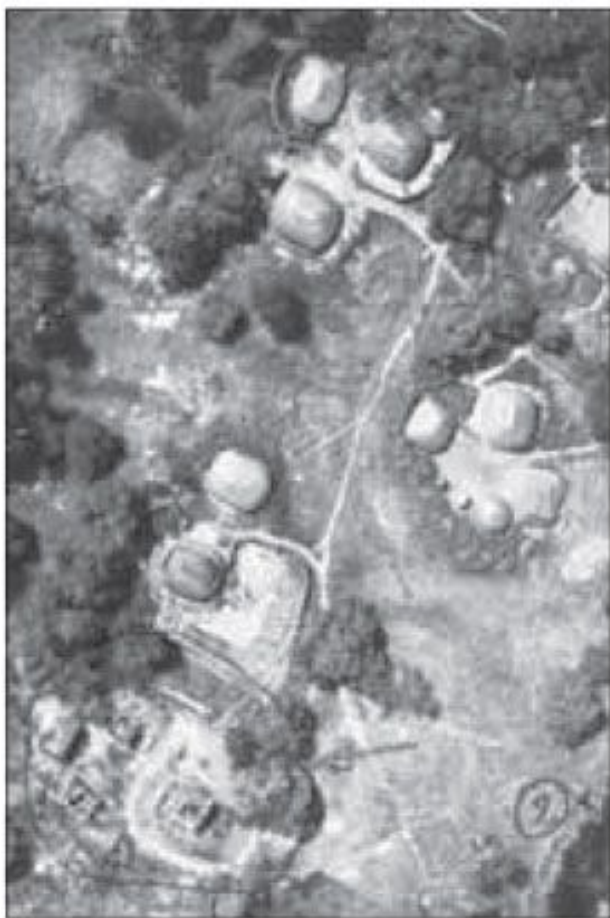
Organização defensiva com espaldões e envolventes de ninhos de metralhadoras.

Terminada a "Operação Samurai" no dia 19 de novembro, o caminho estava aberto para a total ocupação da Ilha do Como pelas FT, em exploração do sucesso. Com efeito, o Gen COMCHEFE registava que, desde fins de Novembro, ao princípio de 1967, a guarnição do Cachil não voltou a sofrer ataques, nem de dia nem de noite. Paradoxalmente, tal exploração nunca ocorreu.