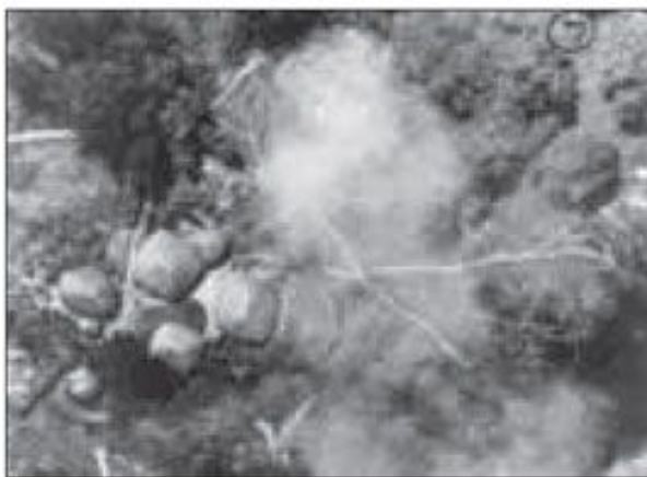
Impactos de bombas napalm .